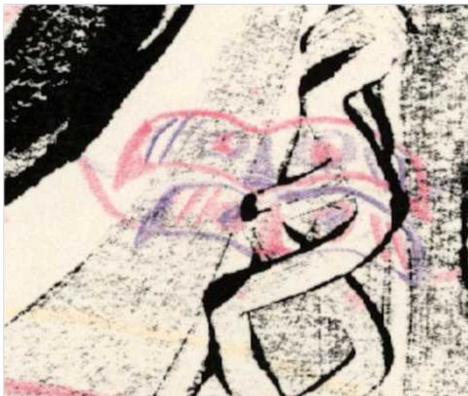
Le masque après la chute