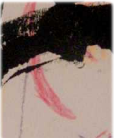
Forme : bouche

Ici on pourra lire l'explication ↓ de l'image quand Blanche se sera décidée de l'écrire