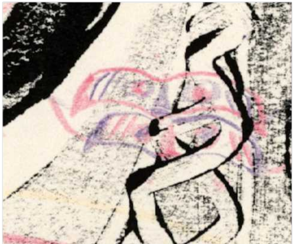
Le masque après la chute