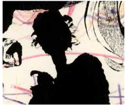
Le pot de fleur